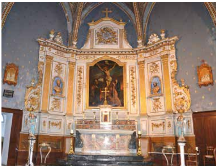
Le tableau de la crucifixion est en cours de restauration

La restauration du Retable de l'Eglise se poursuit. Le tableau de la crucifixion est en cours de restauration et les travaux seront terminés en même temps que ceux du Retable. Les deux œuvres seront restituées et posées en fin d'année 2016 par l'entreprise Parrot.