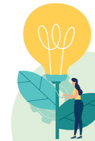
Rénovation énergétique de la Mairie