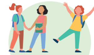
Sécurisation des entrées des écoles