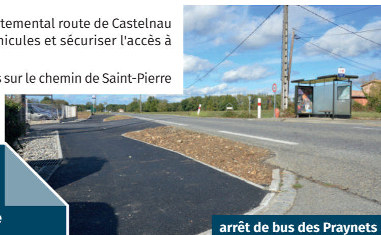
arrêt de bus des Praynets