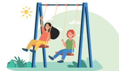
Aire de jeux square du footballeur