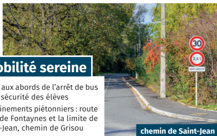
chemin de Saint-Jean