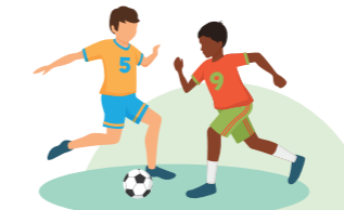
Régénération du terrain de Football