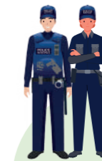
Local de la Police Municipale