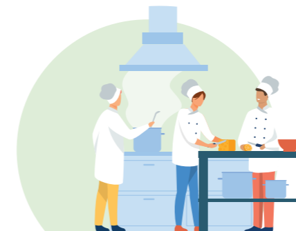
Cuisine sur place