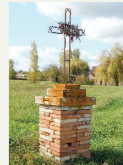
Route de Villaudric à Fombernier