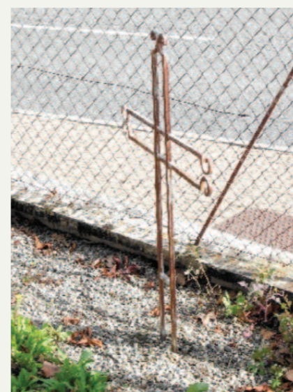
Rue de la Tuilerie à côté de l'école

(PAR L'ASSOCIATION DE RECHERCHES HISTORIQUES DE BOULOC : L'ARHB)