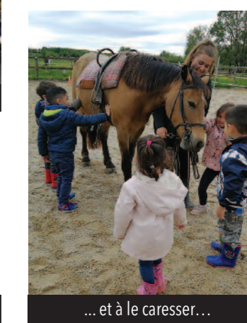
... et à le caresser...