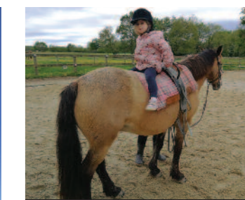
Apprendre à monter le poney...