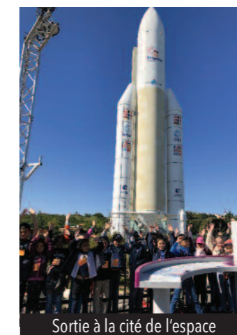
Sortie à la cité de l'espace