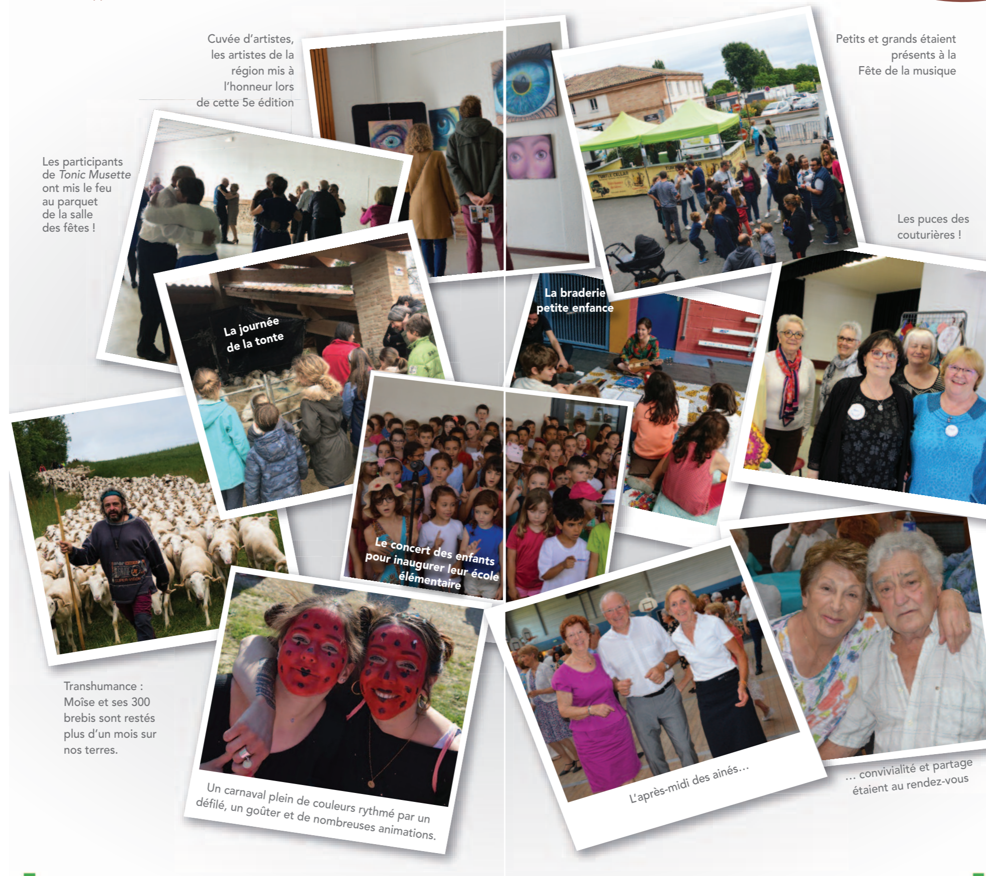
Cuvée d'artistes, les artistes de la région mis à l'honneur lors de cette 5e édition