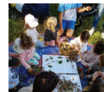
À la découverte du LAND ART