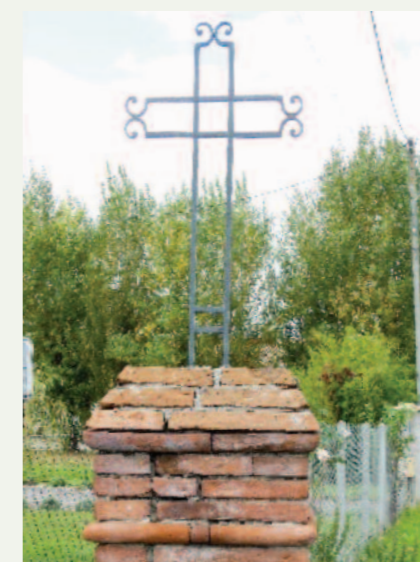
Route de St Rustice à Engriole