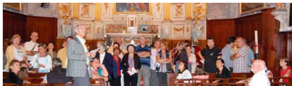
Des anecdotes, des souvenirs et beaucoup d'Histoire au programme.