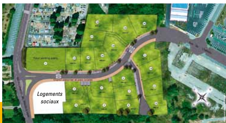
Plan de la zone du Vigé

Une opération d'urbanisation sur 14000 m 2 réalisée, par la société PROMOMIDI. Il s'agit d'un lotissement de 19 lots à bâtir, d'une surface moyenne de 500 m 2 , correspondant à une urbanisation dense en continuité du bourg. Pour répondre aux exigences de la municipalité, le programme est complété par un bâtiment collectif d'un étage comprenant 14 logements sociaux dont la réalisation sera confiée au groupe ARCADE. 200 m 2 sont réservés à hauteur du raccordement de la nouvelle voie sur le chemin du Moulin à Vent pour assurer un dégagement de visibilité et permettre la réalisation d'une liaison douce. Dans ce cadre, la commune a déposé auprès du Conseil Général une demande pour l'étude, en 2013, d'une liaison douce le long du chemin du Moulin à Vent (RD 77) entre la piste cyclable de la route de Castelnau et la sortie d'agglomération en direction du chemin des Bousquets. Cette opération permettra, à terme, aux piétons et cyclistes de circuler en toute sécurité entre la limite de commune en direction de Castelnau d'Estrétefonds et le complexe sportif. L'aménagement d'un parking municipal supplémentaire au bas du cimetière, est également prévu dans cette opération. ●