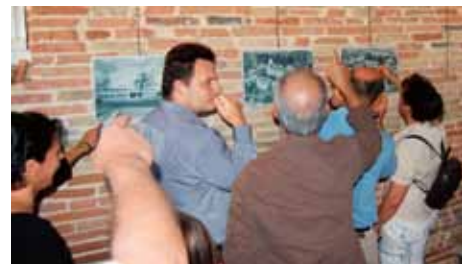
Discussions et échanges entre les souvenirs et les surprises des habitants.