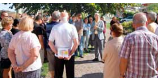
Première participation de Bouloc aux Journées du Patrimoine.