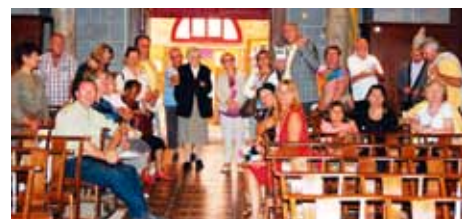
Une visite guidée par Monsieur le Maire.