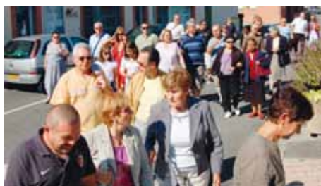
50 personnes ont répondu présent le samedi 15 septembre 2012.