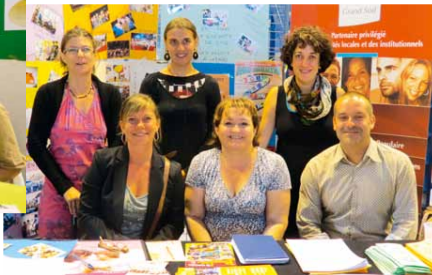
Équipe de coordination et de direction des services Enfance et Jeunesse