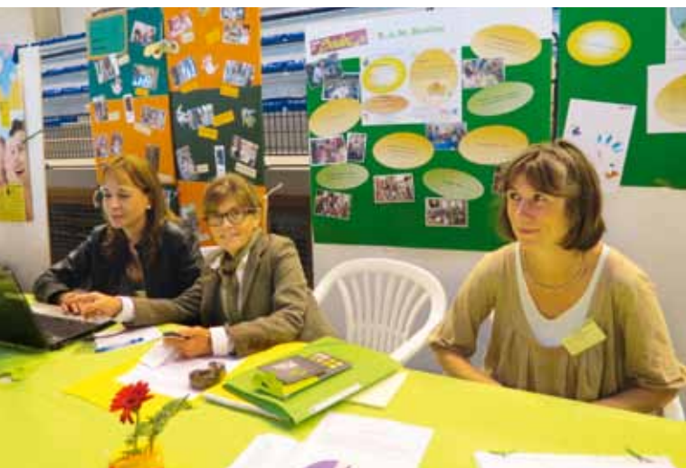
Responsables de la Crèche et du RAM