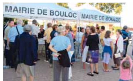
Un vin d'honneur convivial pour conclure cet agréable parcours.

Découverte des cartes postales anciennes exposées dans l'Atelier d'Art.